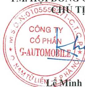
Lê Minh Khuê